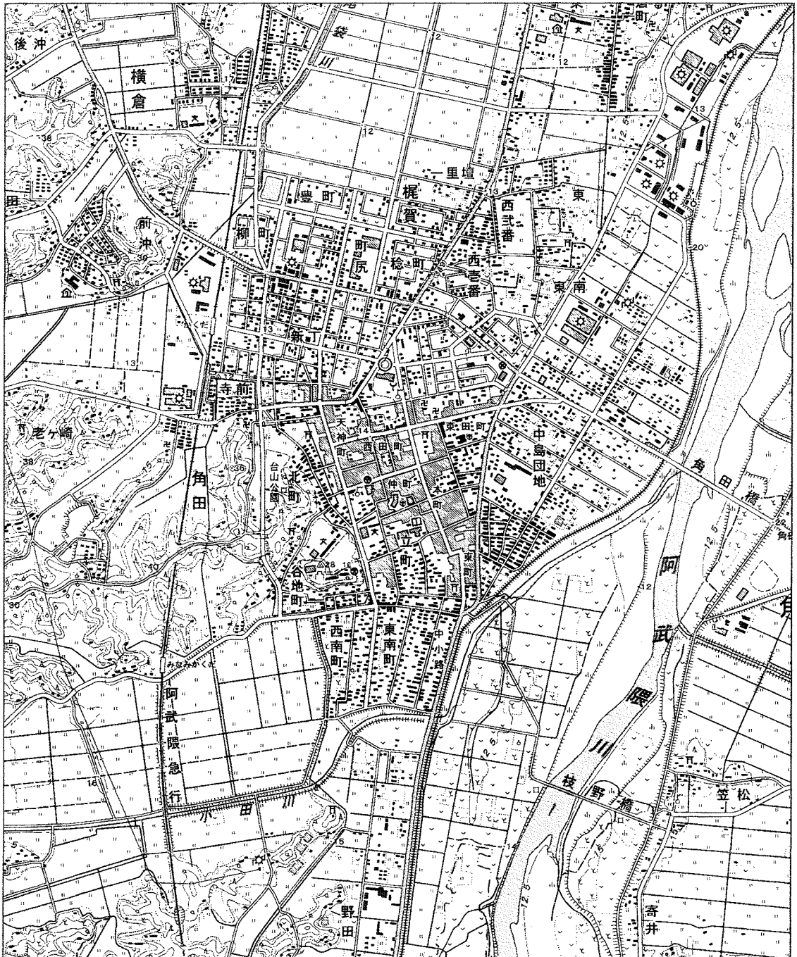
(国土地理院発行2万5千分の1地形図「角田」より一部引用)

問1 この地形図中にある「阿武隈急行」の「かくだ」駅から「みなみかくだ」駅までは地形図上で約7cmあります。実際の距離は約何mになりますか、答えなさい。